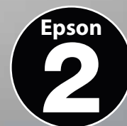
Epson Garantia de 2 anos*